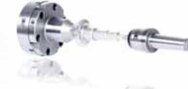
▲ Торцевые поводковые центры для зажима валов