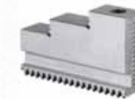
▲ Кулачки твердые