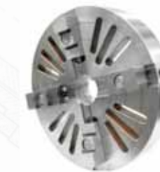
▲ 4-х кулачковая планшайба с независимым перемещением кулачков