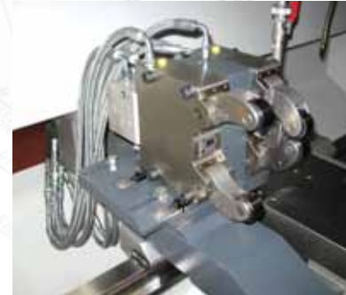
▲ Самоцентрирующий гидравлический подвижный люнет двойной – люнетный тандем