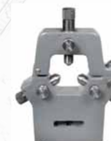
▲ Неподвижный люнет