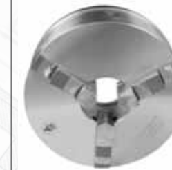
▲ 3-х кулачковый самоцентрирующий патрон