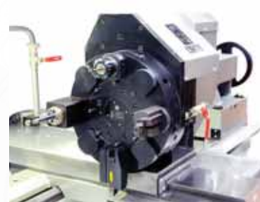
▲ 8-позиционная револьверная головка SAUTER с вращающимся инструментом и тормозом шпинделя