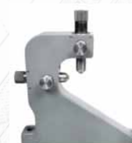
▲ Подвижный люнет