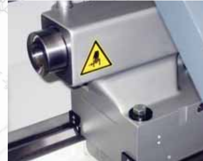
▲ Задняя бабка с гидравлическим управлением выдвижения пиноли