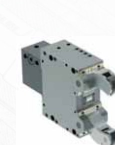
▲ Самоцентрирующий гидравлический подвижный люнет