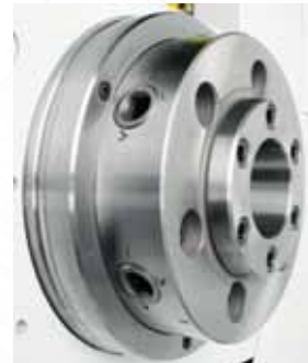
▲ Запирающий замок шпинделя CAMLOCK