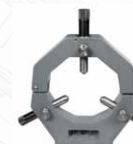
▲ Неподвижный люнет увеличенный