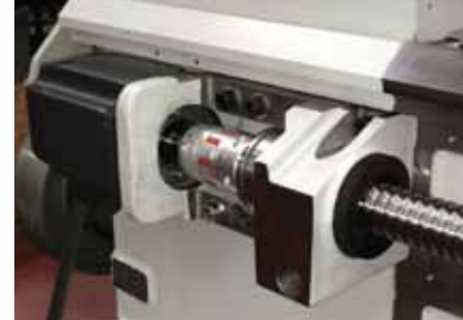
▲ Непосредственный привод ШВП по оси Z