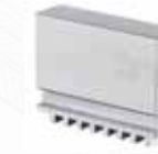
▲ Кулачки мягкие